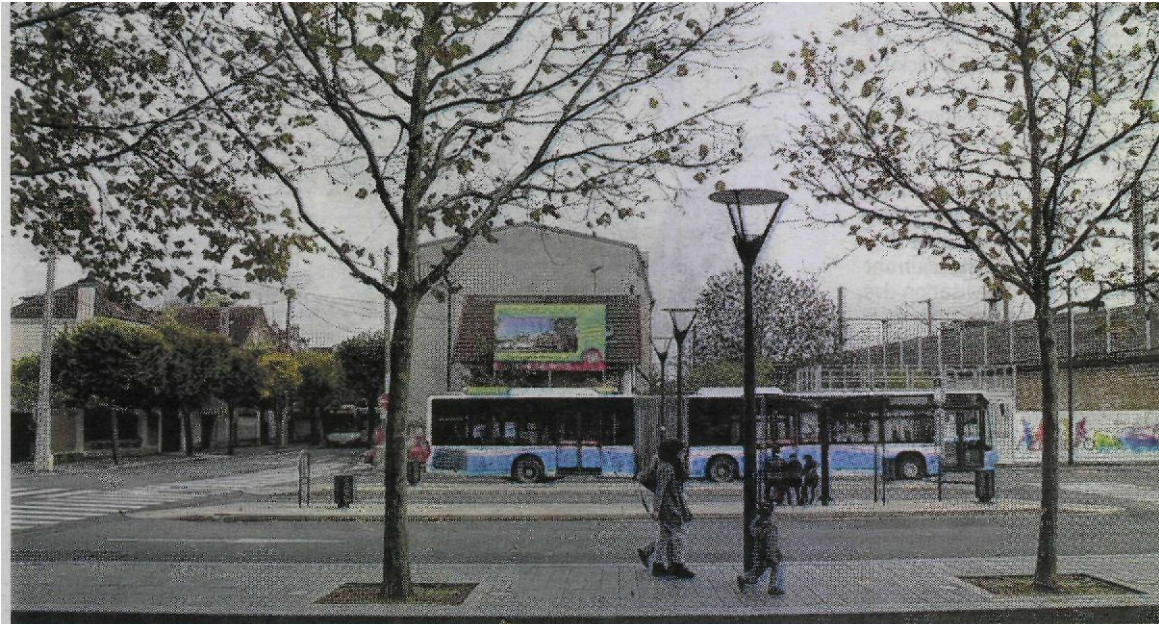
Chelles, le 6 novembre. La construction qui sera réalisée derrière l'immeuble des finances publiques nécessitera la destruction d'une dizaine de pavillons (à gauche). LP/G.CO.)