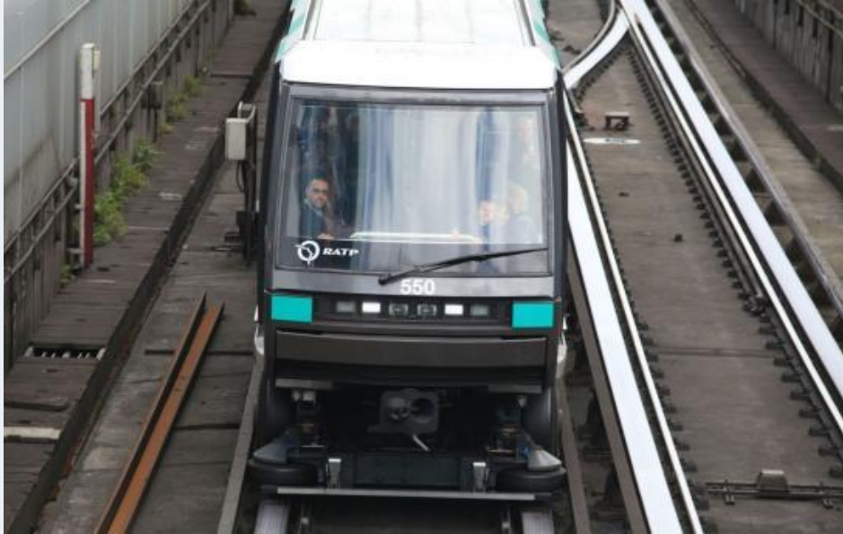
Illustration. Le métro 1 partira de Château de Vincennes pour aller au Val-de-Fontenay en passant par les Rigollots puis soit Grands Pêchers soit Verdun.

« C'est parti ». « Ça y est, on va l'avoir ». « C'est lancé ». Les réactions sont unanimes et plus qu'enthousiastes après le vote par le conseil d'administration du Stif (syndicat des transports d'Ile-de-France) du financement des études et de l'enquête publique pour le prolongement de la ligne 1 du métro jusqu'au Val-de-Fontenay.