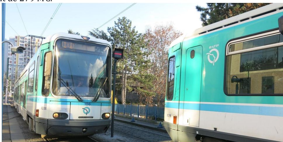
Le T1 arrivera en 2019 à Colombes.

C'est aussi une première petite portion du prolongement du tram T1 au nord-ouest de Paris entre Asnières et Colombes, qui devrait voir le jour à l'été 2019. Le T1 sera en effet étendu de 900 m à Asnières, des Courtilles aux Quatre-Routes. A terme, à l'horizon 2023-2024, le prolongement jusqu'à Colombes transportera 60 000 voyageurs par jour sur 11 nouvelles stations et 6,4 km. Il sera en correspondance avec le T2 et la ligne J du Transilien. Le projet représente un investissement de 279 M€.