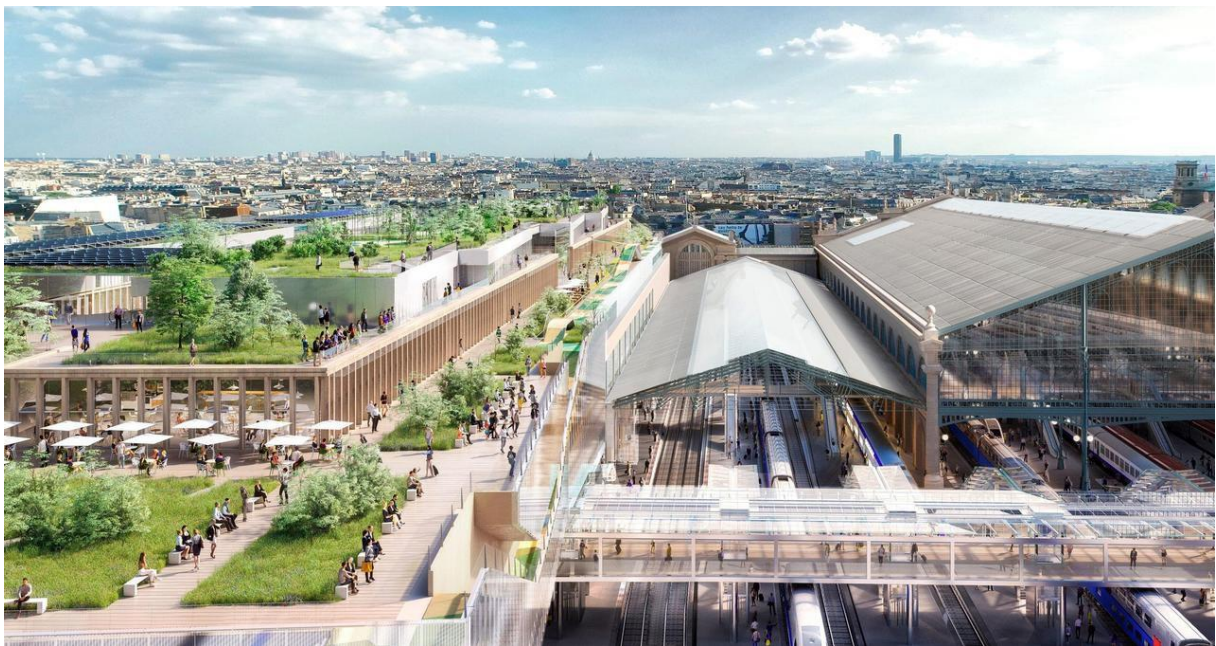
Un jardin, un centre commercial et des trains. Le projet Gare du Nord 2024 vu d'en haut./Architecte Valode and Pistre

Le projet de transformation de la Gare du Nord, lancé en 2017 avec le soutien de la Ville, puis confirmé en 2019 à l'issue d'une série de réunions publiques, prévoit de modifier en profondeur l'organisation de la première gare d'Europe (700 000 voyageurs par jour actuellement, 900 000 attendus en 2030). L'accès au quai des lignes en surface se fera par des passerelles, et le hall actuel ne servira qu'aux sorties.